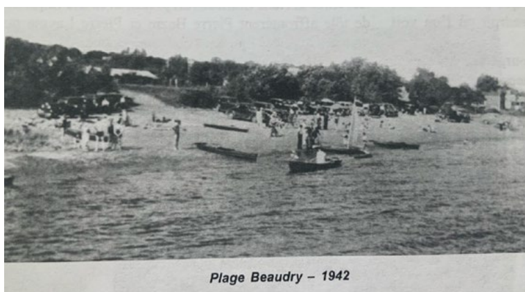
Plage Beaudry - 1942