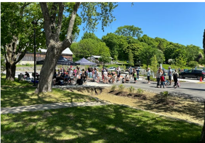
Bernard Gaudreau Votre Maire

Cette même journée a été l'occasion, pour mes collègues du conseil municipal et moi-même, de vous rencontrer et vous distribuer des arbres ainsi que des fines herbes. Vous avez été nombreux à vous présenter, aussi, chaudière à la main, pour recueillir du compost pour le bénéfice de vos potagers. Pour couronner cette journée festive, la Place des Marées a aussi été animée par la fête des voisins. Jeux pour les petits et grands, musique, et hot-dogs étaient au rendez-vous. C'est toujours un plaisir de vous rencontrer lors de ces occasions !