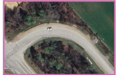
Stationnement incitatif Route Gravel/2 e rang