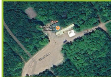
Stationnement incitatif Cabane Chabot