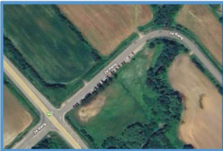
Stationnement incitatif Route 365/2 e rang

Saviez-vous que la Cabane à sucre Chabot, sis 800, 2 e Rang à Neuville, est un stationnement autorisé pour vos activités hivernales ? Il existe, de plus, deux endroits sur le territoire où vous pouvez vous stationner en tout temps soit l'intersection du 2 e Rang et de la route 365 ainsi que celui du 2 e Rang et de la route Gravel.